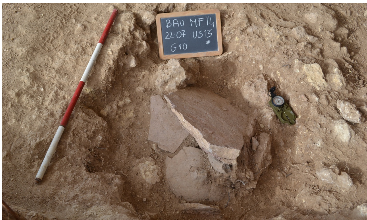
Fig. 6 US 13. Inumazione in anfora punica del tipo 5.4.4.2. di Ramòn

La tipologia maggiormente attestata è l' enchytrismòs . In totale sono state individuate quattro sepolture entro vasi (UUSS 3, 10, 12 e 13), appartenenti a infanti, tutte prive di corredo. In un caso è stata utilizzata un'anfora punica del tipo 5.4.4.2. di Ramòn, databile al V sec. a.C. (fig. 6). Quest'ultimo contenitore era posto in una fossa scavata all'interno del dromos della tomba monumentale ed era protetto da lastre di calcare provenienti dai vicini Monti di Trabia.