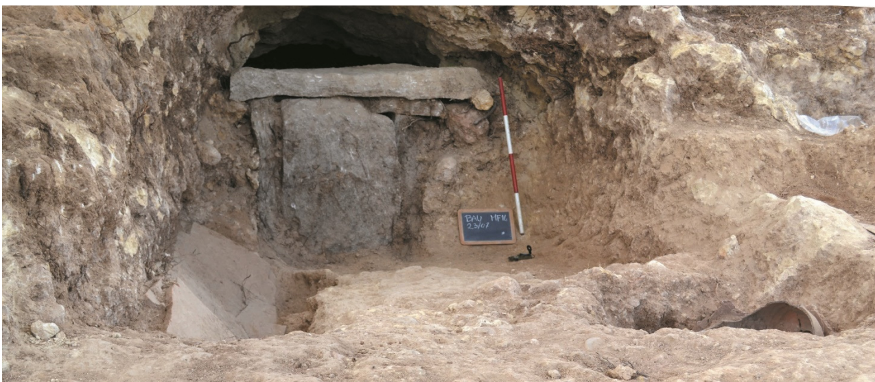
Fig. 8 Portale d'ingresso e corridoio d'accesso della tomba a grotticella artificiale n. 18

Infine, ricordiamo la grande tomba a grotticella artificiale (US 18) (fig. 8). All'interno sono stati recuperati i resti di circa 20 inumati 14 e si è proceduto alla setacciatura della terra di riempimento. La sepoltura fu utilizzata per un periodo compreso tra la fine del VI e la fine del V sec. a.C., ed era dotata, a giudicare dai reperti recuperati, di una ricchissima suppellettile. I corredi mostrano una composizione mista greco-indigena: sono presenti, infatti, frammenti di ceramica a vernice nera, a figure rosse, vasellame acromo e ceramica indigena a decorazione dipinta, oltre ad alcuni frammenti della parte inferiore di un'anfora punica. Inoltre, sono stati recuperati un buon numero di reperti di pregio: si tratta di oggetti in metallo, tra cui tre anelli d'argento e quattro in bronzo, oggetti in osso lavorato, manufatti in ferro, alcuni falchetti e frammenti di pugnali, una fibula ad arco semplice, una moneta di bronzo della zecca di Agrigento databile tra il 425 e il 400 a.C., alcuni vaghi di collana e un pendente.