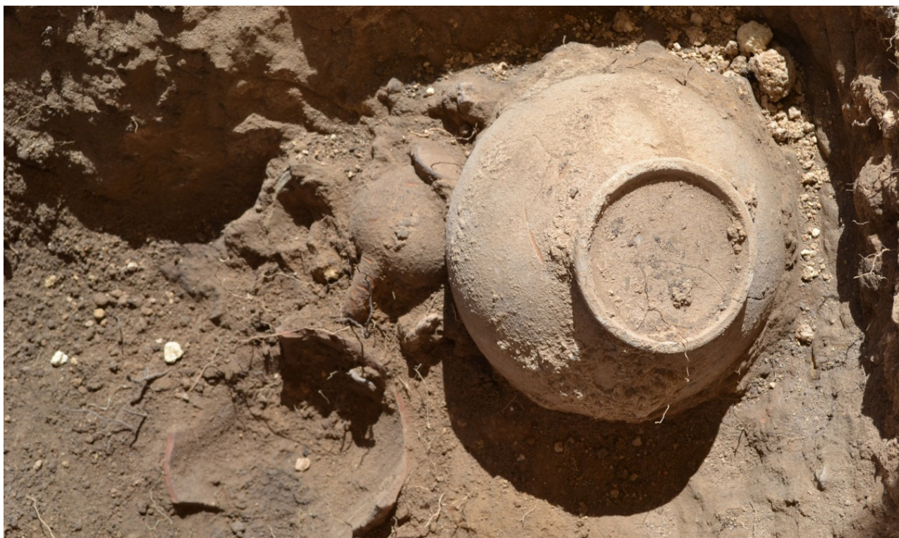
Fig. 7 US 14. Deposizione di vasi dopo il rogo funebre

collocati dopo lo spegnimento del rogo (fig. 7). Questo tipo di rituale ad incinerazione è attestato in questo periodo sia a Himera 11 , sia nelle città di Palermo 12 e Solunto 13 .