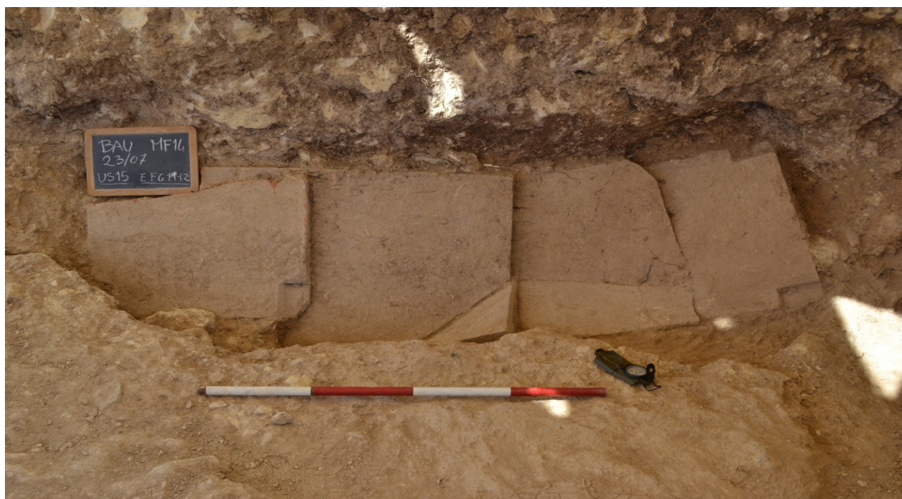
Fig. 4 US 15. Tomba con copertura a tegoli piani

Le inumazioni in fossa terragna (UUS 6, 8, e 9) appartengono a individui adulti. Soltanto la 6 risultava dotata di corredo (uno skyphos d'importazione), mentre l'inumato della tomba 9 era in posizione flessa.