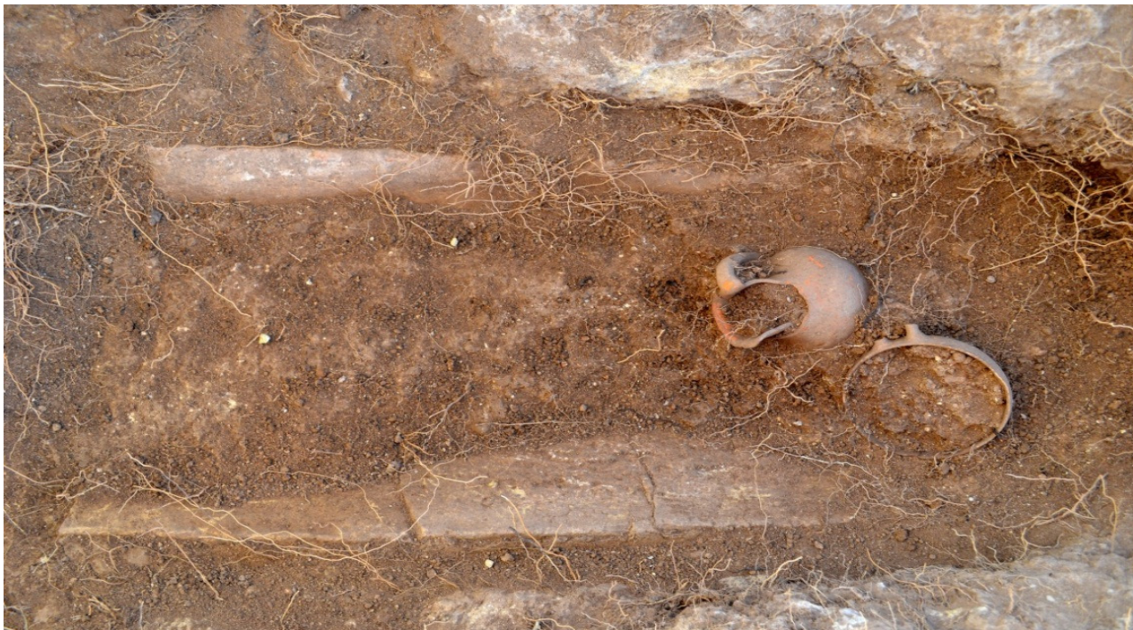
Fig. 3 US 2. Tomba entro coppi

Le tombe tra kalypteres appartenevano a due infanti (UUS 1 e 2), di cui non si sono conservate le ossa. I corredi comprendevano rispettivamente, la prima un' oinochoe a bocca trilobata e uno skyphos a vernice nera ad anse contrapposte; la seconda un' olpe e una coppetta, entrambe acrome (fig. 3).