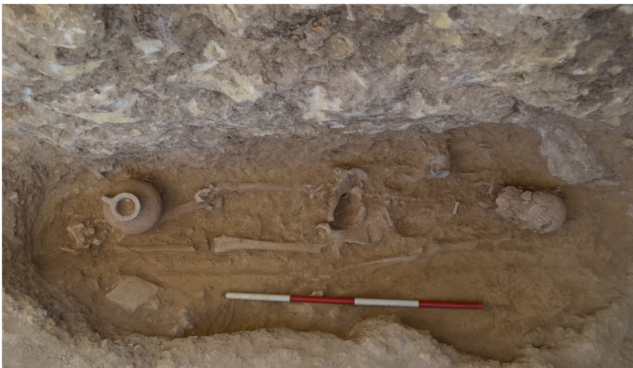
Fig. 5 US 15. Tomba con copertura a tegoli piani in corso di scavo

La tipologia maggiormente attestata è l' enchytrismòs . In totale sono state individuate quattro sepolture entro vasi (UUSS 3, 10, 12 e 13), appartenenti a infanti, tutte prive di corredo. In un caso è stata utilizzata un'anfora punica del tipo 5.4.4.2. di Ramòn, databile al V sec. a.C. (fig. 6). Quest'ultimo contenitore era posto in una fossa scavata all'interno del dromos della tomba monumentale ed era protetto da lastre di calcare provenienti dai vicini Monti di Trabia.