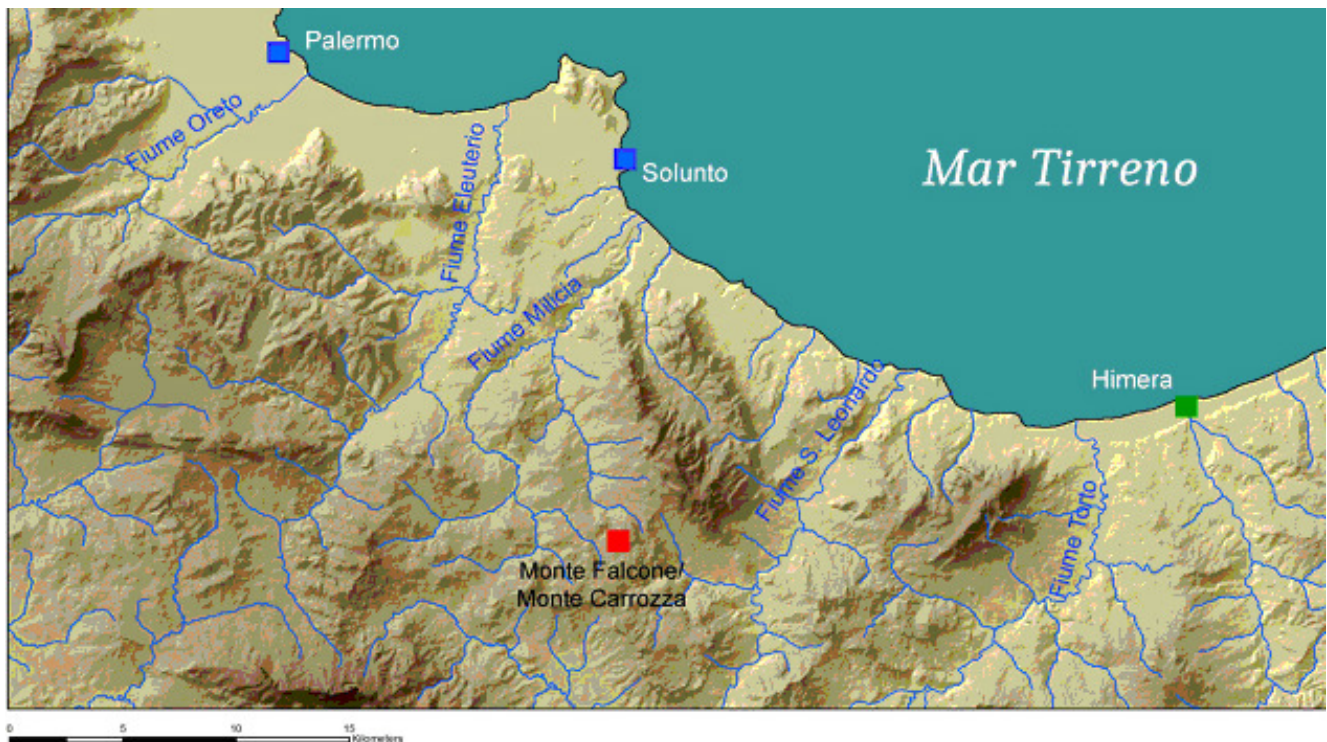
Fig. 1 L'area della Sicilia centro-settentrionale con indicati i siti di Palermo, Solunto, Himera e Monte Falcone/Monte Carrozza

Nel mese di Luglio 2014 la Cattedra di Topografia antica dell'Università degli Studi di Palermo, in convenzione con la Soprintendenza dei Beni Culturali di Palermo e con il sostegno logistico e finanziario del Comune di Baucina, ha ripreso le indagini sul sito indigeno di Monte Falcone/Monte Carrozza (fig. 1) che, grazie alla sua posizione in una zona di frontiera tra le colonie fenicio puniche di Palermo e Solunto e la polis calcidese di Himera, può essere considerato un osservatorio significativo per lo studio dei rapporti tra Greci, Punici e Indigeni.